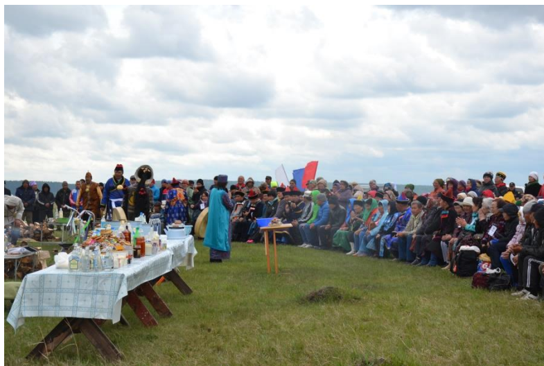
Саламатный ёхор в рамках празднования 160-летия П.П. Баторова. 2010 г. Аларь