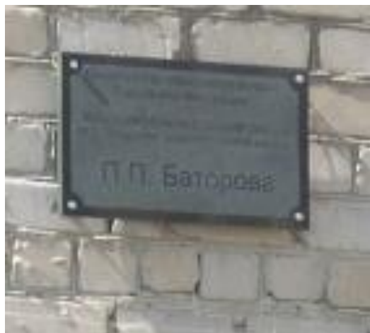
Мемориальная доска на стене Аларской средней школы