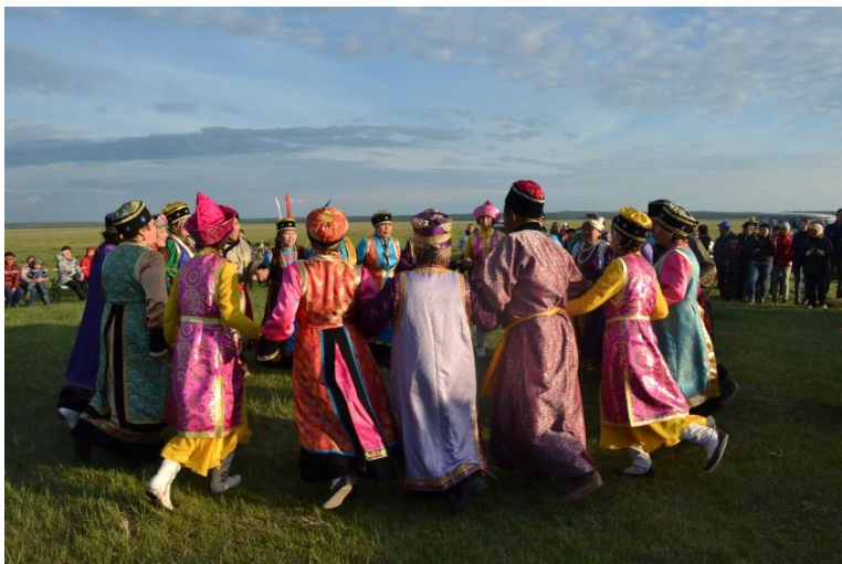
Фольклорный ансамбль «Аялга» из с. Ныгда. 2010 г. Аларь