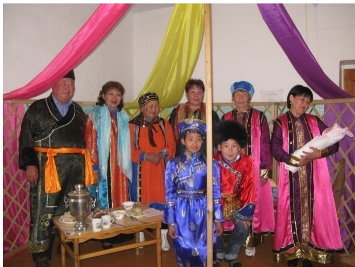
Обряд Улгызэ оруулха (первого пеленания и укладывания ребенка в колыбель), в рамках НПК «Баторовские чтения-2010». Аларь