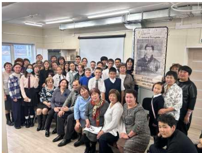
Участники III Межрегиональной научно-практической конференции «Баторовские чтения», 18 октября 2023 г. п.Кутулик