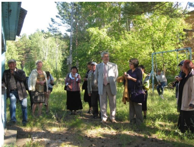
Баторовская роща. Улзет. 2010