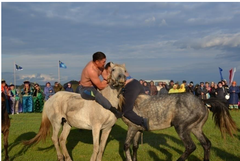
Игры «Ехэ зоохэй наадан» в рамках празднования 160-летия П.П. Баторова. 2010 г. Аларь