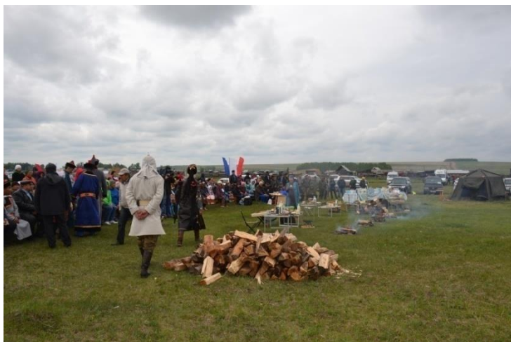
Саламатный ёхор в рамках 160-летия П.П. Баторова. 2010 г. Аларь