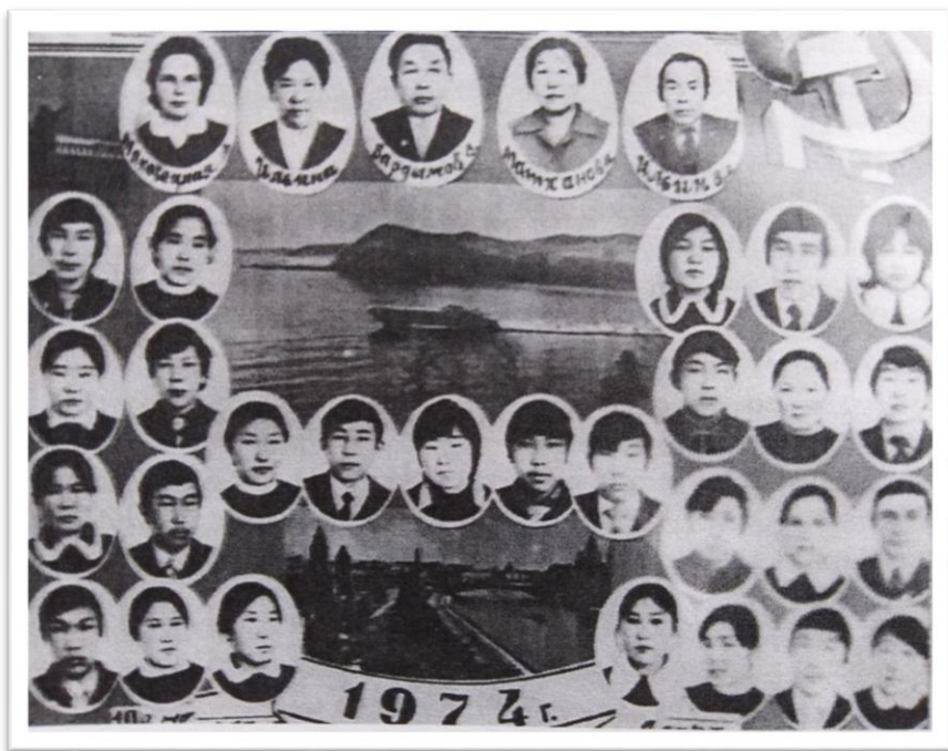
Выпуск 1974 года. Работала завучем по учебно-воспитательной работе

Все ребята подняли руки. Это было что-то! Ученики решили поддержать учителя, проявили необычную солидарность. От прилива необъяснимых чувств я чуть не подвела себя, учеников, районное руководство. Выручил конспект урока. Гостям из Москвы пришлось по душе рассуждения сельских ребят. Простые, предметные, грамотно оформленные мысли. Были в классе 3-4 девушки-звездочки. Они и задали тон уроку. Цитировали стихотворные строки, как умели анализировали, выражая свое понимание пусть немного заученно. Урок прошел по классической схеме: дозировка по времени выдержана, активность учащихся высокая и т.д. Было сказано: “Урок цели достиг...”. Дальше анализ. И после анализа, счастливая, пошла в класс, там оставались мои девушки-звездочки. Я дала волю своим радостным чувствам. При анализе